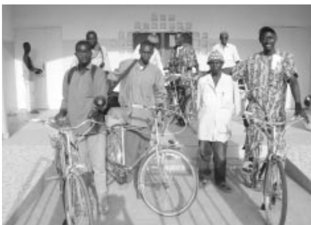
Figure 2 - L'Association PAH dote en bicyclette les agents de santé communautaire afin de faciliter l'approvisionnement en médicaments et leur participation aux journées de formations, Ouonck, Casamance.

Il est urgent de discuter du rôle gestionnaire des comités de santé pour que la répartition des recettes, quelles que soient leurs origines, se fasse équitablement et dans la transparence ; la formation des comités de santé dans ce sens est donc une priorité. La dynamisation ou la mise en place du