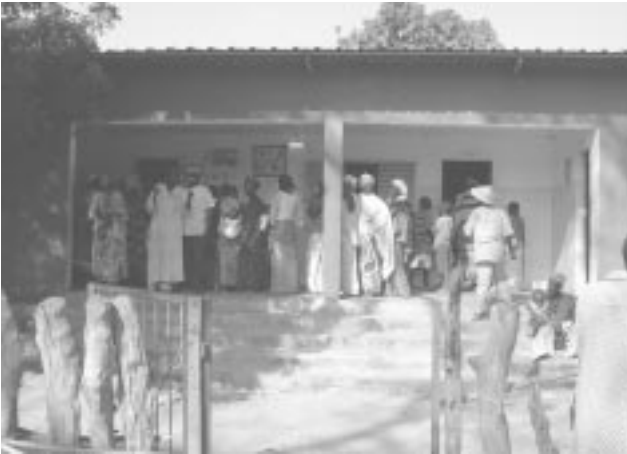
Figure 4 - Vue du poste de santé de Ouonck, Casamance.